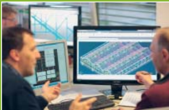
Wenn aus Visionen sichtbare Objekte werden.