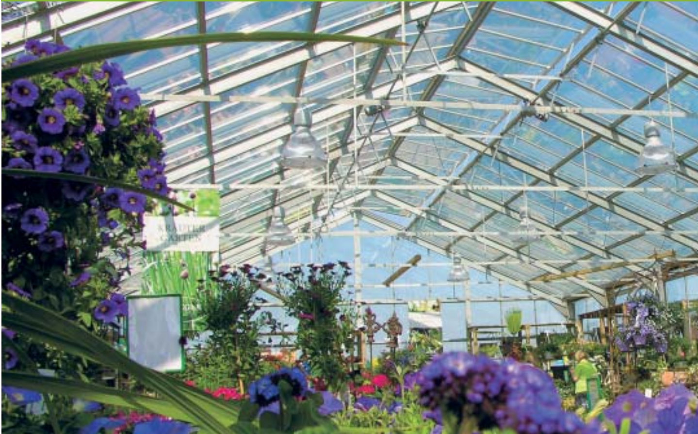
Referenzbeispiele beliebter Plonka-Erlebniswelten