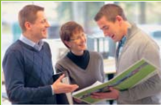
Lösungsorientierte Fachberatung steht vor jeder Planung.